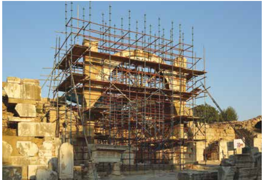
Der eingerüstete Domitiansbrunnen im Herbst 2016

Politische Spannungen zwischen Österreich und der Türkei waren der Grund, dass wir am 31. August 2016 die Grabung Ephesos binnen eines Tages schließen und das Land verlassen mussten. Uns traf diese Entscheidung aus heiterem Himmel, waren doch große Grabungs- und Restaurierungsprojekte im Laufen. Diese mussten jäh unterbrochen werden, ohne die notwendigen Sicherungsmaßnahmen einzuleiten.