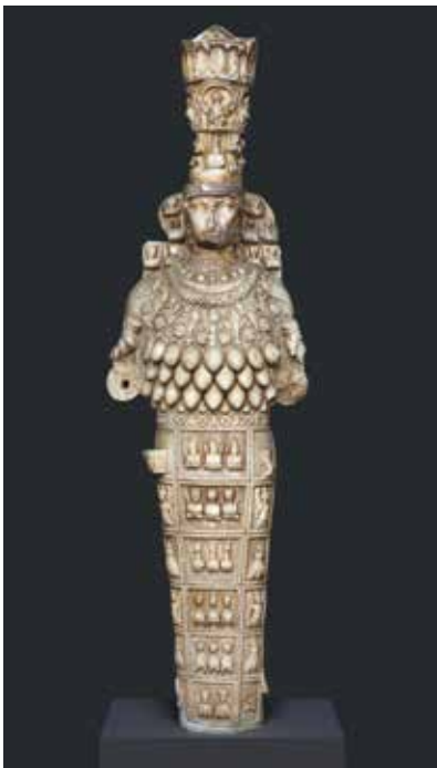
Die große Artemis von Ephesos – Beschützerin der Stadt und ihrer Bewohner

und effektiven österreichisch-türkischen Zusammenarbeit geliebt? Im kollektiven Gedächtnis der Ephesos-Forschung war man an Josef Keil und Aziz Oğan Bey erinnert, die das Flaggschiff der mediterranen Archäologie durch weitaus herausforderndere Zeiten im 20. Jahrhunderts navigiert hatten. Nein, für Resignation sollte kein Platz sein. Die unge-