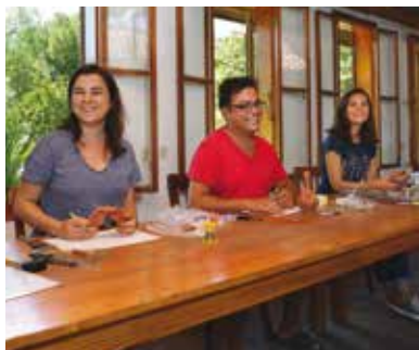
Das Depot von Ephesos nach der Wiederaufnahme der Arbeiten 2018

Grabungsantrag für das Folgejahr zu stellen. Nun galt es, die günstigen Vorzeichen zu nutzen und mit Optimismus an die konkreten Planungen zu gehen. Die Unterstützung der Förderer war ungebrochen, das Team motiviert und Ephesos schien auf uns zu warten – die große Göttin hatte uns nicht vergessen! Am 26. Juli 2018 um 8 Uhr 23 erhielten wir das lang ersehnte Schriftstück: die Grabungsgenehmigung. Die Freude war unbeschreiblich, aber auch die Dankbarkeit an jene Personen im Hintergrund groß, die in Wien, Paris, Brüssel, Selçuk und Ankara zwei Jahre lang hart gearbeitet hatten, um uns diese Rückkehr zu ermöglichen.